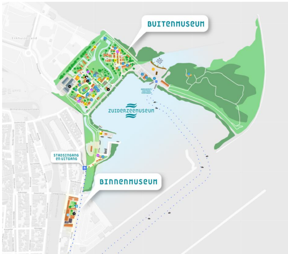
Zuiderzeemuseum last-mile map